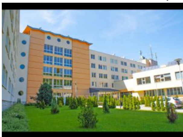
Widok budynku sanatorium od strony patio