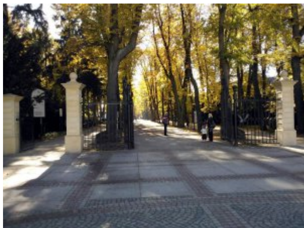
Uzdrowskowie MSW „Agat” w Jeleniej Górze