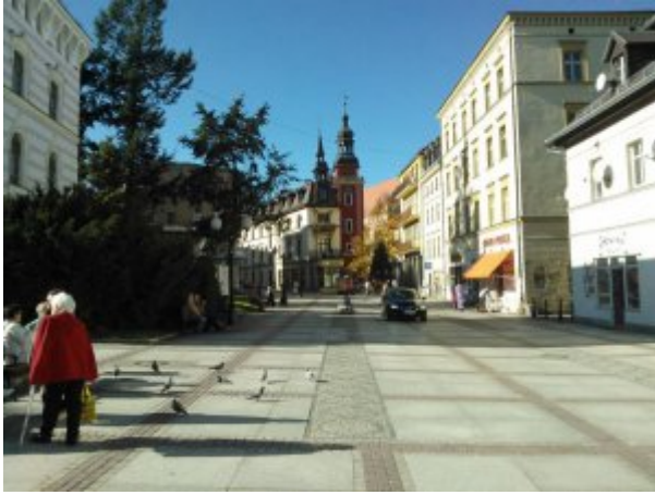
Centrum Cieplic-Zdroju – deptak