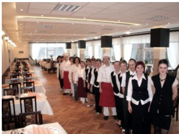
Jadalnia w sanatorium