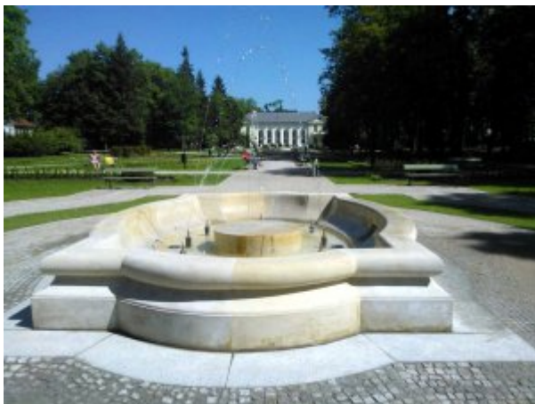
Fontanna w Parku Zdrojowym fot. SP ZOZ

Sanatorium Uzdrowskowie MSW „Agat” w Jeleniej Górze