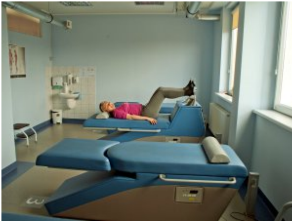
Gabinet chiroterapii