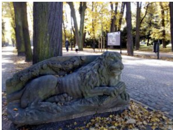
Zdrojowego, fot. SP ZOZ Sanatorium Uzdrowskowie MSW „Agat” w Jeleniej Górze