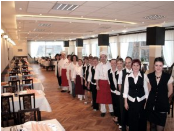
Jadalnia w sanatorium