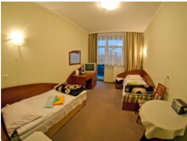
Pokój 2-osobowy #1