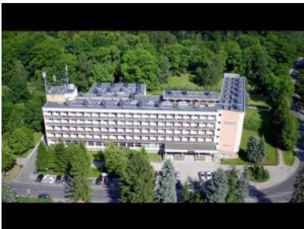
Widok budynku sanatorium z lotu ptaka