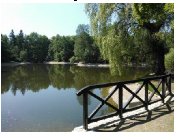
Staw w Parku Norweskim