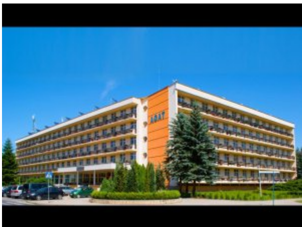
Budynek SP ZOZ Sanatorium Uzdrawiskowego MSW „Agat” w Jeleniej Górze – Cieplicach-Zdroju

Zapoznaj się z informacjami o Samodzielnym Publicznym Zakładzie Opieki Zdrowotnej Sanatorium Uzdrawiskowym Ministerstwa Spraw Wewnętrznych „AGAT” w Jeleniej Górze