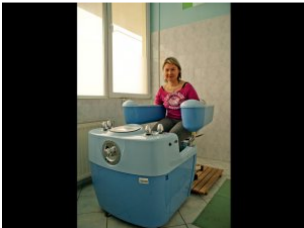
Kąpiel czterokomorowa