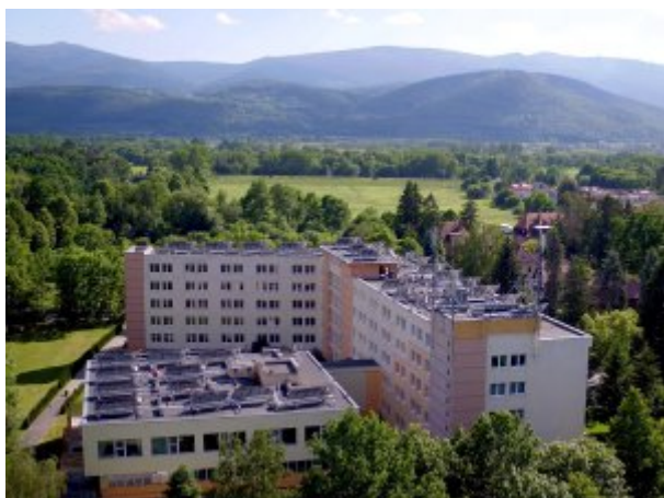
Widok budynku sanatorium na tle Karkonoszy, fot. SP ZOZ Sanatorium Uzdrawiskowe MSW "Agat" w Jeleniej Górze