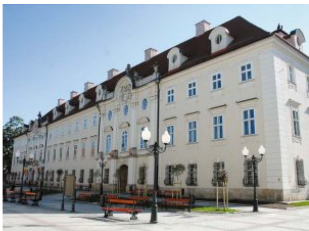
Centrum Cieplic-Zdroju - Pałac Schaffgotschów