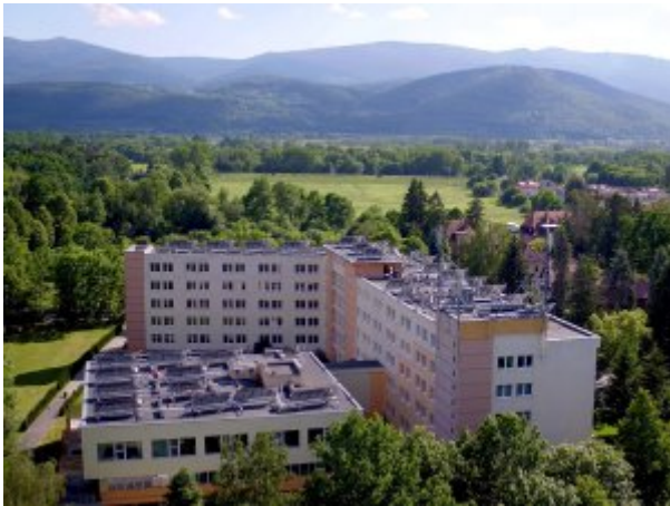
Widok budynku sanatorium na tle Karkonoszy