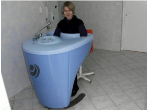
Baza zabiegowa – kąpiel wirowa rąk, fot. SP ZOZ Sanatorium Uzdrowskowie MSW „Agat” w Jeleniej Górze