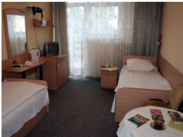
Pokój 2-osobowy #2