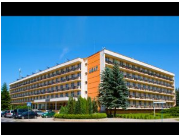
Budynek SP ZOZ Sanatorium Uzdrowiskowego MSW „Agat” w Jeleniej Górze – Cieplicach-Zdroju

Zapoznaj się z informacjami o Samodzielnym Publicznym Zakładzie Opieki Zdrowotnej Sanatorium Uzdrowiskowym Ministerstwa Spraw Wewnętrznych „AGAT” w Jeleniej Górze