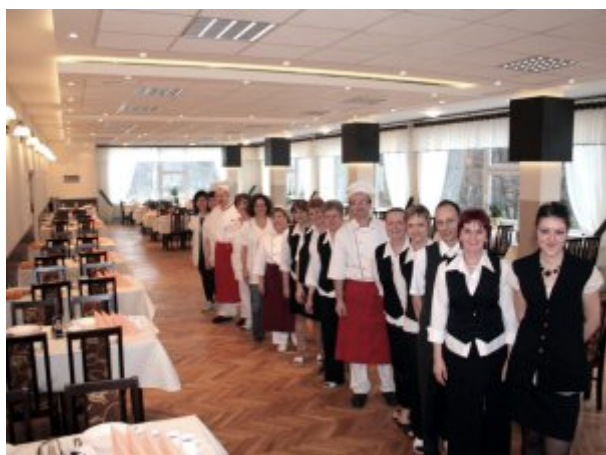
Jadalnia w sanatorium