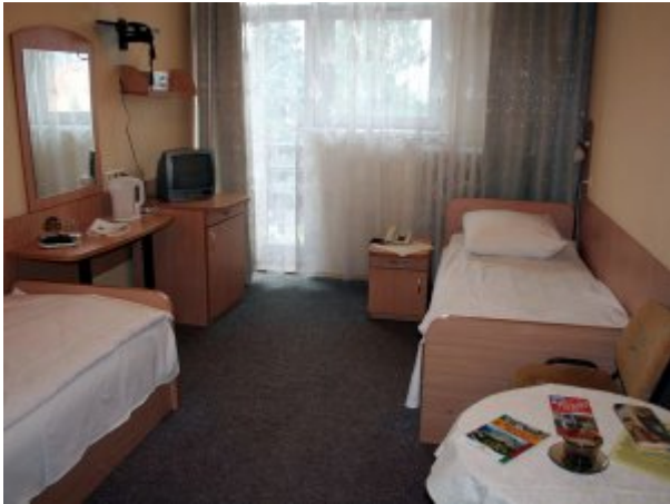
Pokój 2-osobowy #2