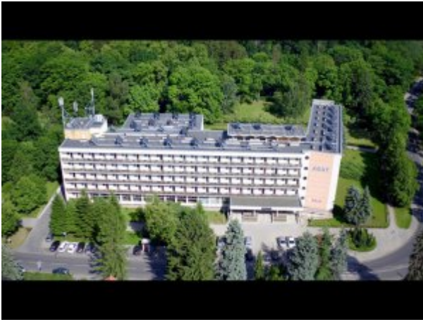
Widok budynku sanatorium z lotu ptaka