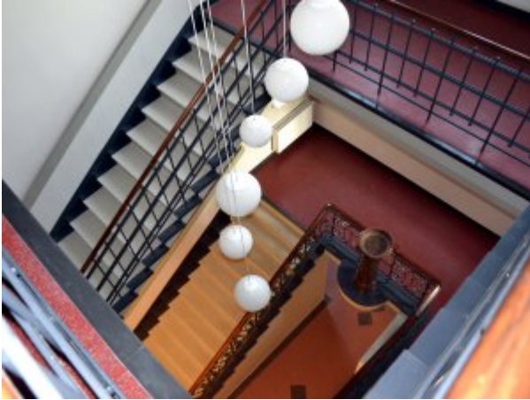
Schody i hol w Przychodni SP ZOZ MSW w Koszalinie