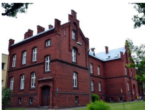
Budynek SP ZOZ MSW w Koszalinie

Zapoznaj się z informacjami o Samodzielnym Publicznym Zakładzie Opieki Zdrowotnej Ministerstwa Spraw Wewnętrznych w Koszalinie