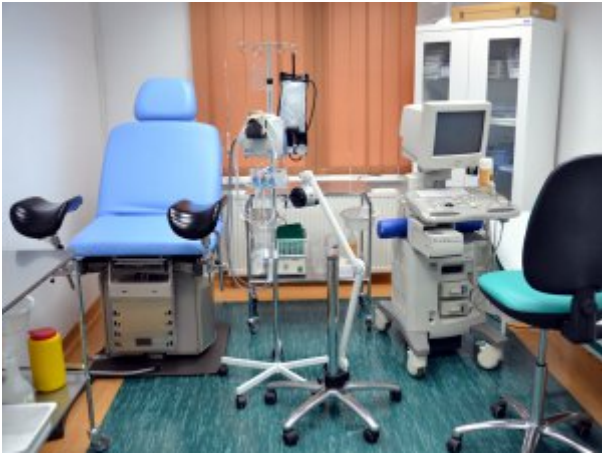
Poradnia urologiczna - Przychodnia SP ZOZ MSW w Słupsku