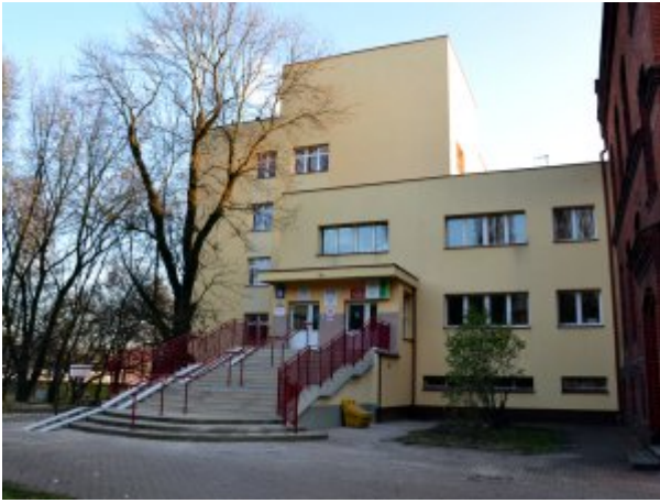
Wejście do Przychodni SP ZOZ MSW w Koszalinie