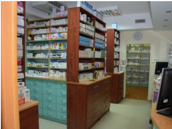
Apteka otwarta w Koszalinie