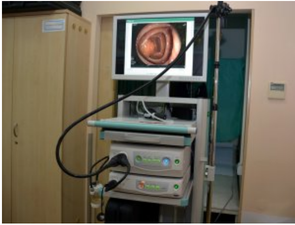
Pracownia badań endoskopowych, fot. Bernard Pacewicz, SP ZOZ MSW w Koszalinie