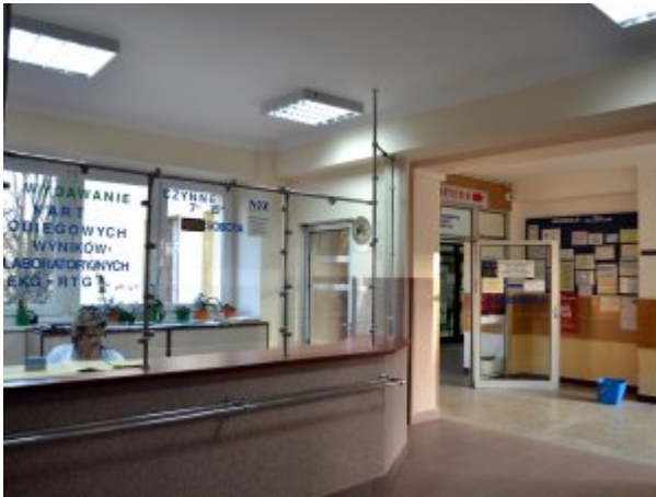
Informacja w SP ZOZ MSW w Koszalinie