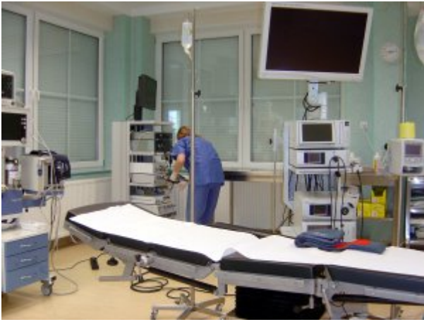
Blok operacyjny w Słupsku, fot. Grażyna Margas, SP ZOZ MSW w Koszalinie