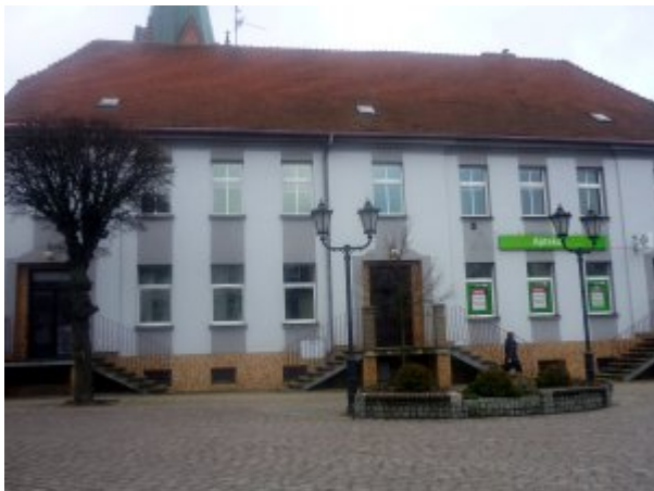
Budynek, w którym znajduje się Przychodnia w