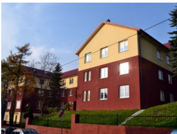
Budynek Przychodni SP ZOZ MSW w Słupsku #1