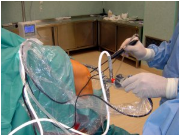
Blok operacyjny SPZOZ MSW w Słupsku - artroskopia kolana