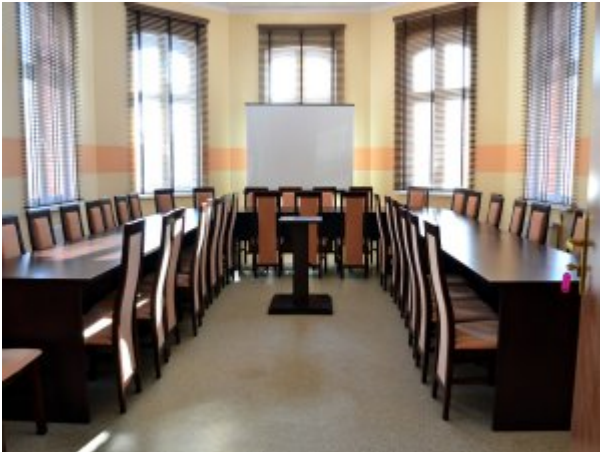
Sala konferencyjna w SP ZOZ MSW w Koszalinie