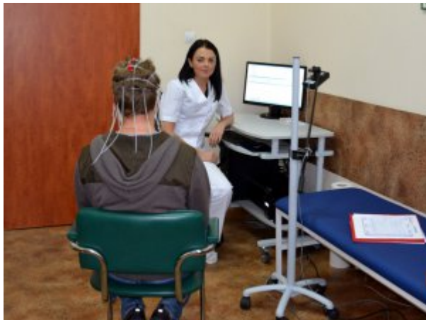
Badanie EMG. Pracownia Badań neuroelektrofizjologicznych, fot. Grażyna Margas, SP ZOZ MSW w Koszalinie