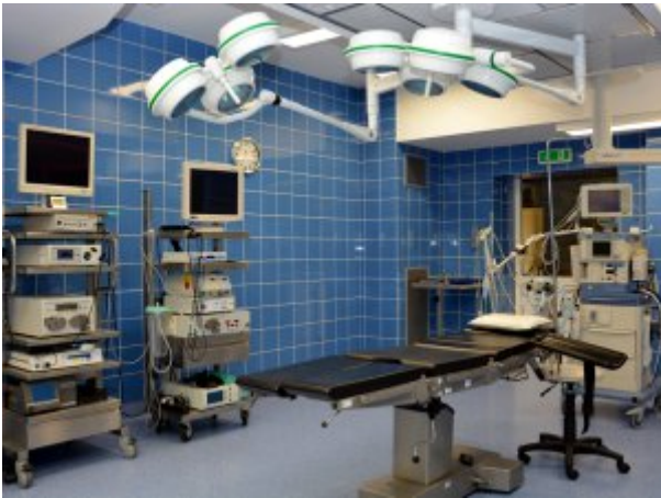
Blok operacyjny w Koszalinie, fot. Bernard Pacewicz, SP ZOZ MSW w Koszalinie