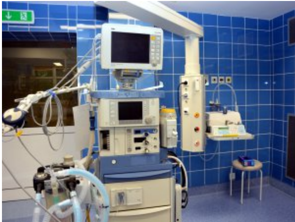
Aparat do znieczuleń na bloku operacyjnym w Koszalinie

więzadła #2