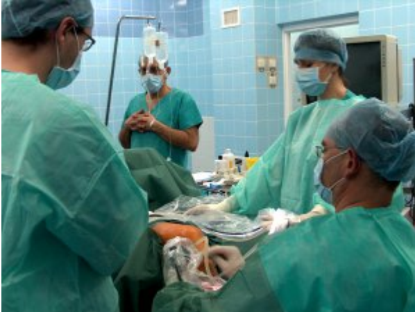
Blok operacyjny w Koszalinie - rekonstrukcja więzadła #1