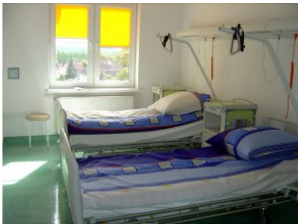
Sala chorych w Zakładzie Pielęgnacyjno-Opiekuńczym SP ZOZ MSW w Słupsku, fot. Grażyna Margas, SP ZOZ MSW w Koszalinie