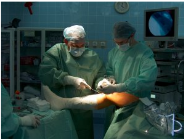
Blok operacyjny w Koszalinie - rekonstrukcja