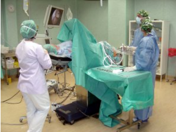
Zespół pracowników bloku operacyjnego w Słupsku wykonuje artroskopię kolana