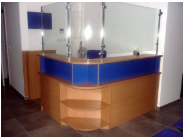
Połczynie-Zdroju, fot. Grażyna Margas, SP ZOZ MSW w Koszalinie