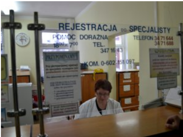
Rejestracja do lekarzy w Przychodni SP ZOZ MSW w Koszalinie