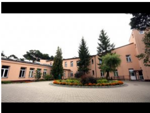
Budynek główny Szpitala MSW w Otwocku z oddziałami Leczenia Uzależnień i Rehabilitacji Medycznej

Zapoznaj się z informacjami o Samodzielnym Publicznym Zakładzie Opieki Zdrowotnej Szpitalu Specjalistycznym Ministerstwa Spraw Wewnętrznych w Otwocku