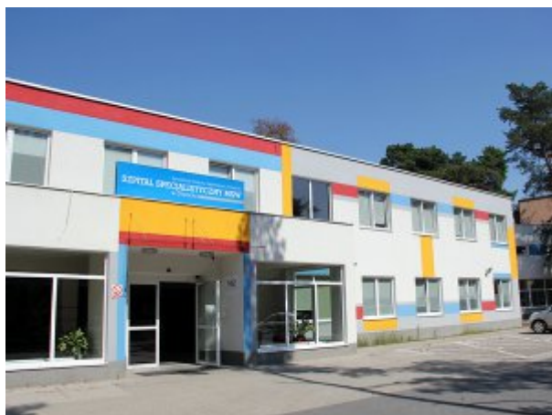
Front i wejście główne do nowego pawilonu Oddziału Rehabilitacji Medycznej