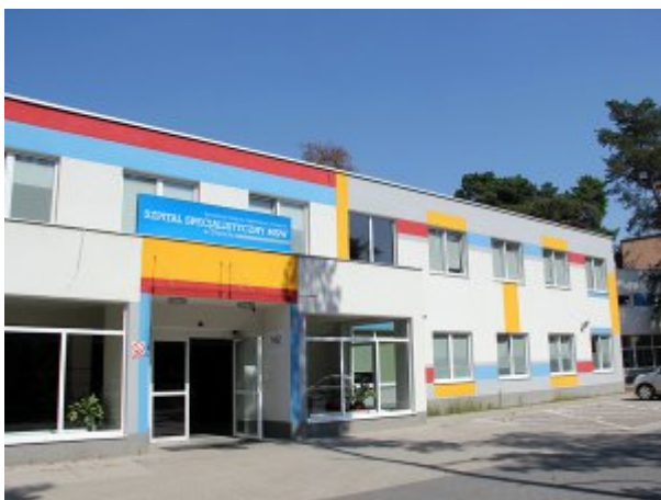
Front i wejście główne do nowego pawilonu Oddziału Rehabilitacji Medycznej