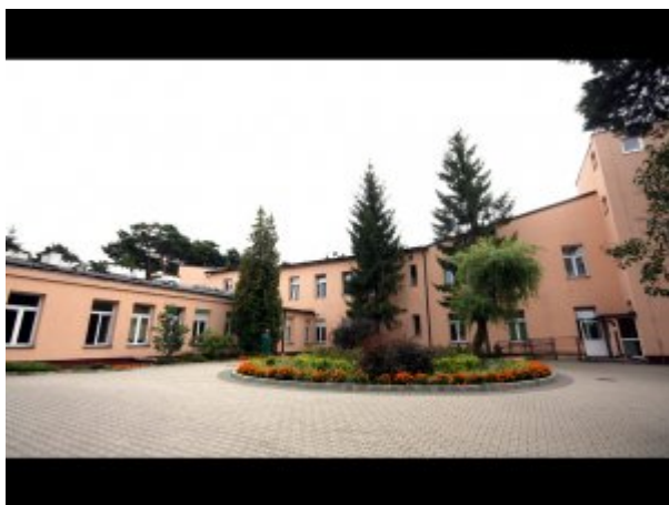
Budynek główny Szpitala MSW w Otwocku z oddziałami Leczenia Uzależnień i Rehabilitacji Medycznej

Zapoznaj się z informacjami o Samodzielnym Publicznym Zakładzie Opieki Zdrowotnej Szpitalu Specjalistycznym Ministerstwa Spraw Wewnętrznych w Otwocku