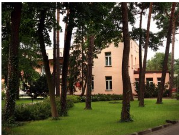
Budynek główny Szpitala MSW w Otwocku wraz z otaczającym go parkiem