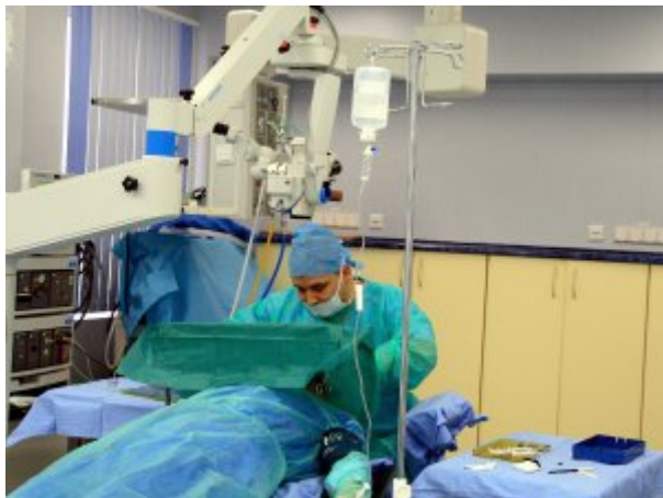
Zabieg operacyjny wykonywany w Oddziale