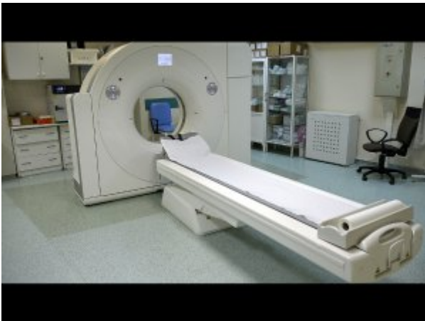
Nowoczesny 64-warstwowy tomograf komputerowy