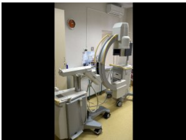
Wyposażenie Pracowni Endoskopowej SP ZOZ MSWiA w Szczecinie