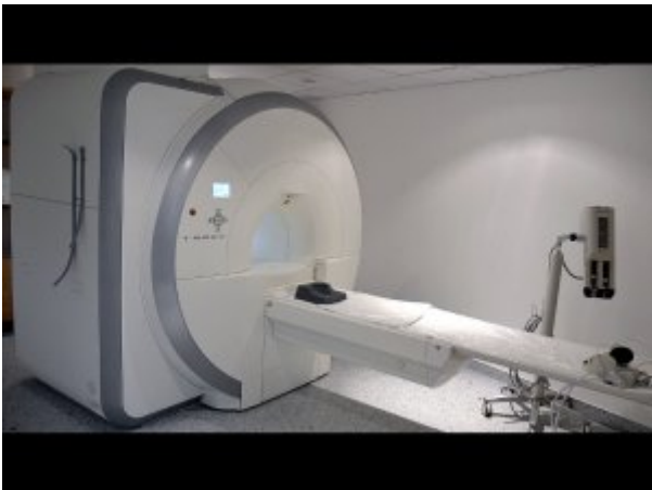
Nowoczesny 1,5-teslowy rezonans magnetyczny