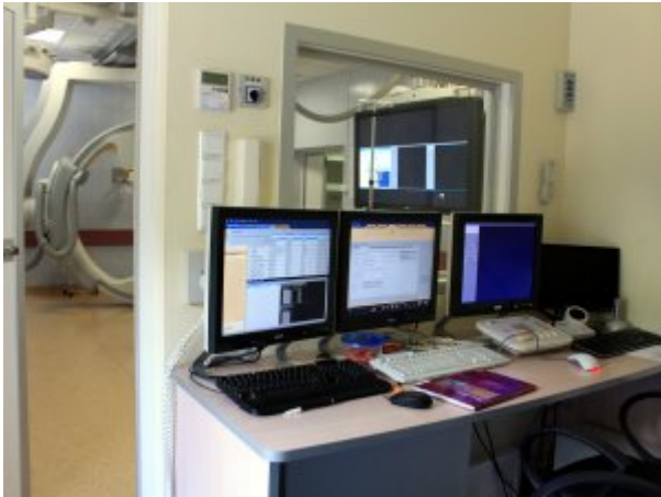
Wyposażenie Pracowni Naczyniowej, fot. SP ZOZ MSWiA w Szczecinie

Okulistycznym, fot. SP ZOZ MSWiA w Szczecinie