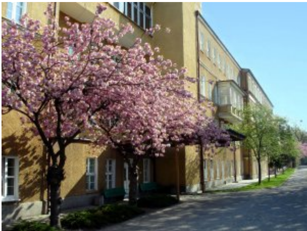
Budynek Główny SP ZOZ MSWiA w Szczecinie