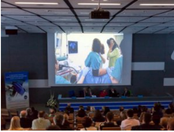
Transmisja satelitarna na żywo z Warsztatów Endoskopowych „Workshop”, fot. SP ZOZ MSWiA w Szczecinie