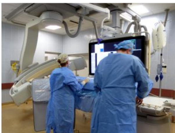
Nowoczesny angiograf wykorzystywany przy wykonywaniu zabiegów z zakresu neuroradiologii zabiegowej oraz chirurgii naczyniowej, fot. SP ZOZ MSWiA w Szczecinie

Zapoznaj się z informacjami o Samodzielnym Publicznym Zakładzie Opieki Zdrowotnej Ministerstwa Spraw Wewnętrznych i Administracji w Szczecinie