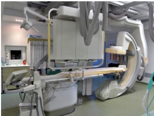
Pracownia Radiologii Zabiegowej #1