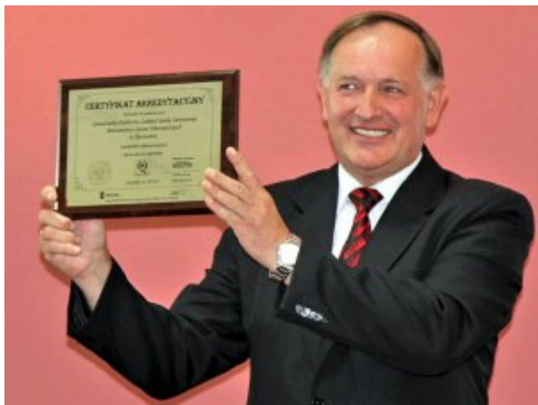
Otrzymanie Certyfikatu Akredytacyjnego