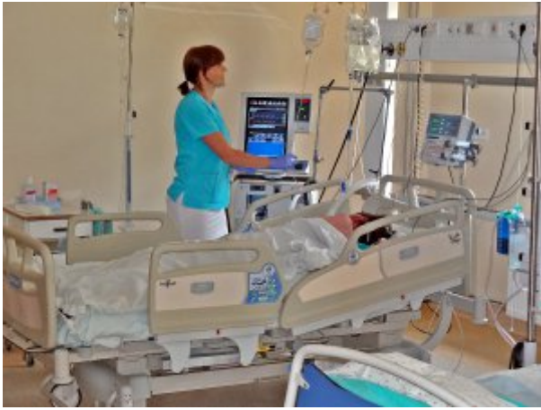
Oddział Anestezjologii i Intensywnej Terapii