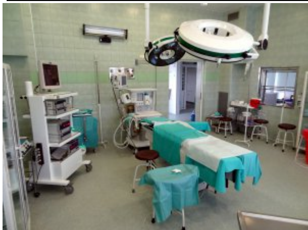
Blok Operacyjny #1