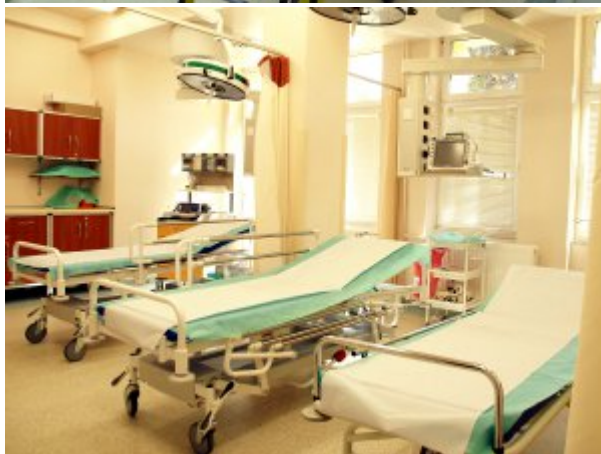
Izba Przyjęć #2