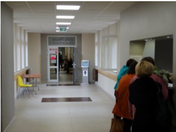
Przychodnia w Rzeszowie #1