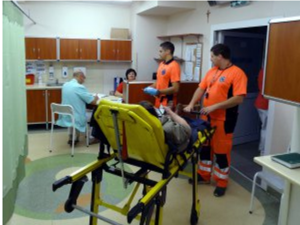
Izba Przyjęć #1