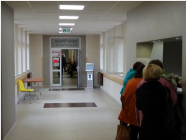
Przychodnia w Rzeszowie #1