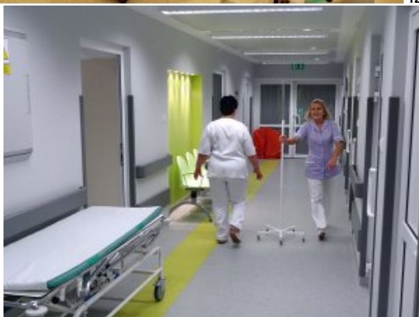
Oddział Chirurgiczny Ogólny z Pododdziałem Endoskopii Zabiegowej, fot. SP ZOZ MSWiA w Rzeszowie