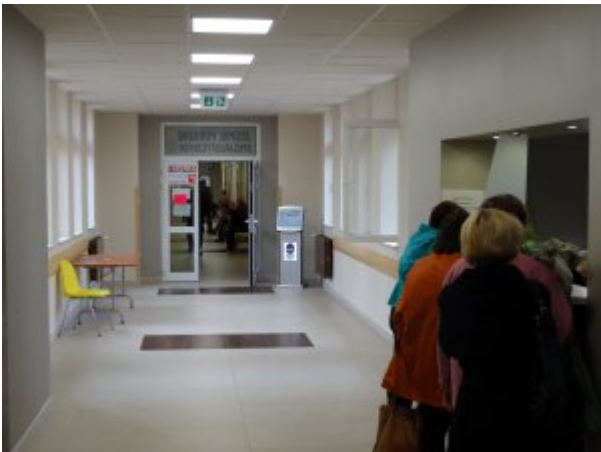
Przychodnia w Rzeszowie #1