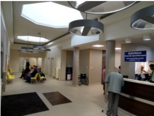
Przychodnia w Rzeszowie #2