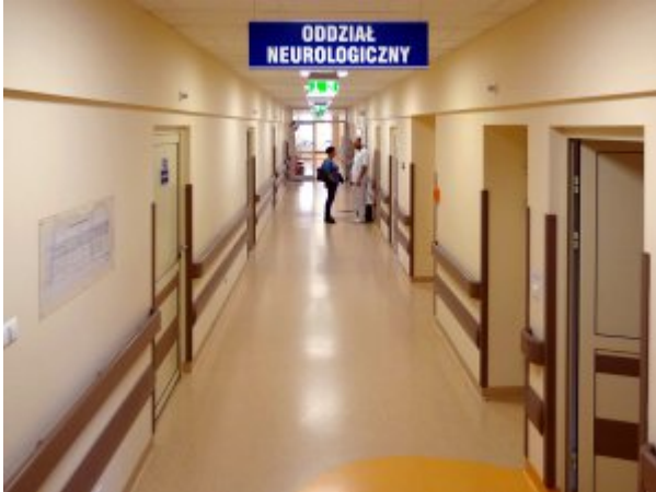
Oddział Neurologiczny