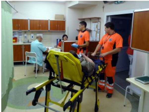
Izba Przyjęć #1