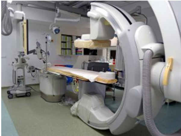
Pracownia Radiologii Zabiegowej #2, fot. SP ZOZ