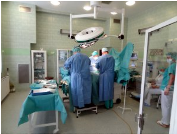
Blok Operacyjny #2