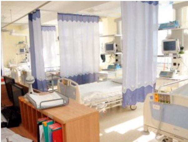
Oddział Kardiologiczny