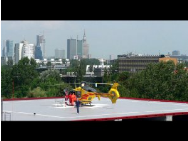
Lądowisko dla śmigłowców na dachu budynku Centralnego Szpitala Klinicznego MSWiA w Warszawie