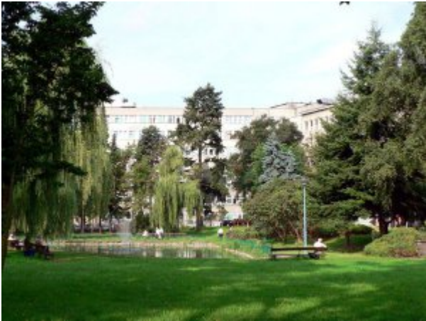
Ogród przy Centralnym Szpitalu Klinicznym MSWiA w Warszawie