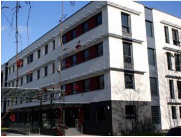
Centralny Szpital Kliniczny MSWiA w Warszawie – budynek K, fot. CSK MSWiA w Warszawie