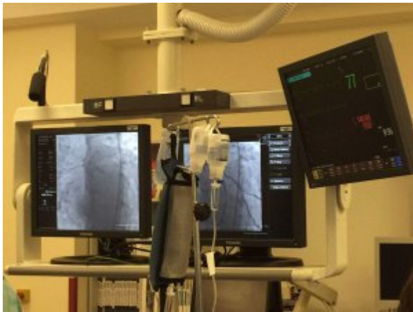
Wyposażenie jednego z oddziałów intensywnej terapii