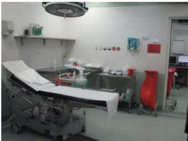
Gabinet Zabiegowy - Szpitalny Oddział Ratunkowy