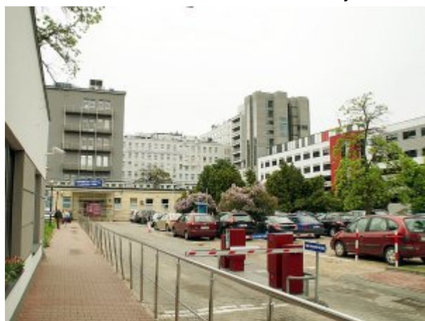
Centralny Szpital Kliniczny MSWiA w Warszawie – wejście główne od ul. Wołoskiej