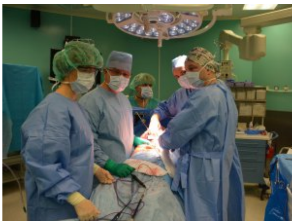
Operacja na bloku operacyjnym - Klinika Gastroenterologii i Chirurgii Transplantacyjnej CSK MSWiA