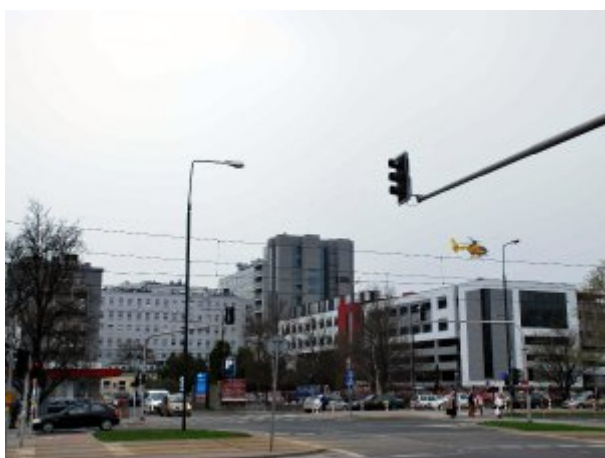
Widok na kompleks szpitalny CSK MSWiA od ulicy Wołoskiej

Zapoznaj się z informacjami o Centralnym Szpitalu Klinicznym Ministerstwa Spraw Wewnętrznych i Administracji w Warszawie