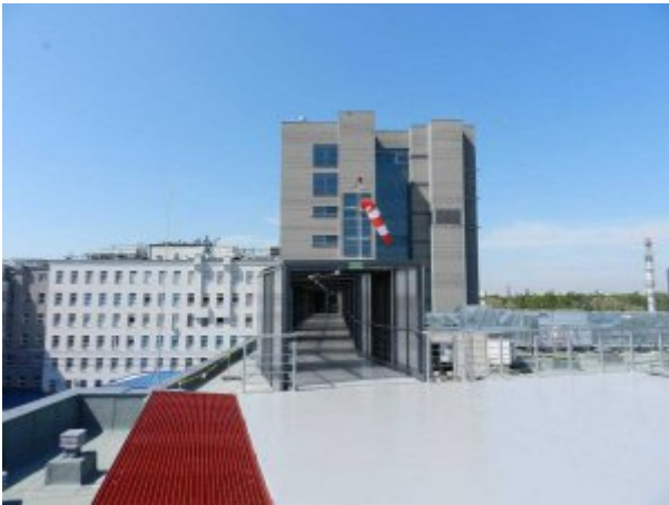
Widok na Pawilon Główny z płyty lądowiska