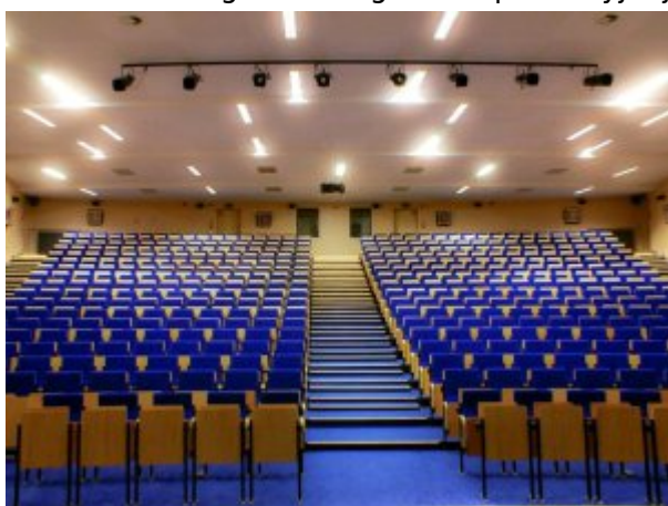
Aula w budynku A-G Centralnego Szpitala Klinicznego MSWiA w Warszawie #1