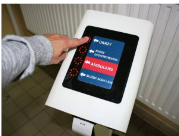
System wspomagający zarządzanie ruchem chorych

Zapoznaj się z informacjami o Samodzielnym Publicznym Zakładzie Opieki Zdrowotnej Ministerstwa Spraw Wewnętrznych i Administracji w Krakowie