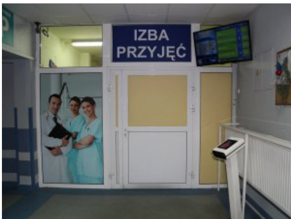
Wejście do Izby Przyjęć i Pomocy Doraźnej