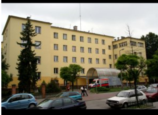
Wejście główne, fot. SP ZOZ MSWiA w Krakowie