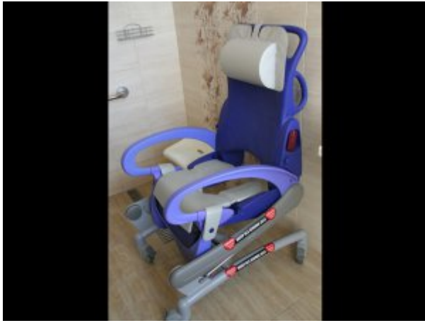
Fotel kąpielowy