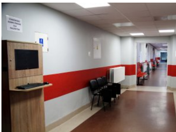
Komunikacja między budynkami szpitala