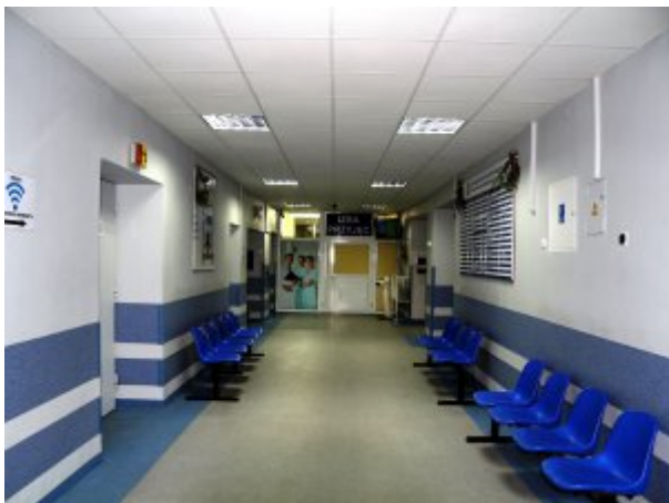
Poczekalnia dla pacjentów oczekujących na przyjęcie do Izby Przyjęć i Pomocy Doraźnej oraz rejestracji