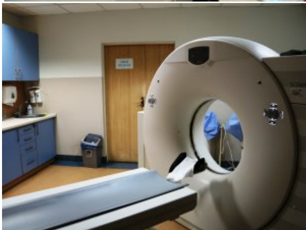
Zakład Diagnostyki Obrazowej